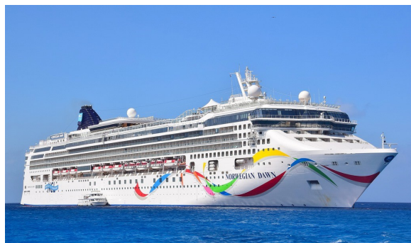
Votre navire : NCL Dawn