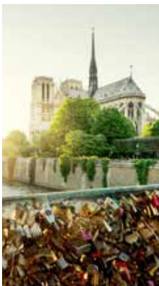
Le pont des Arts