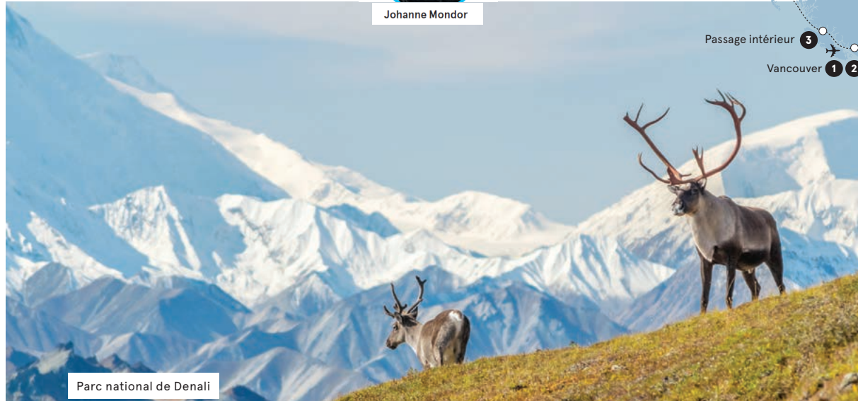
Parc national de Denali