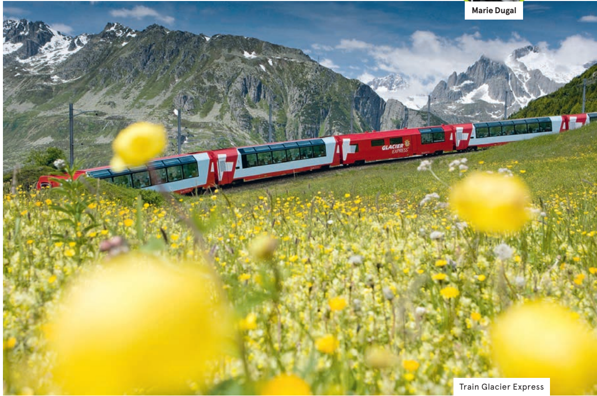
Train Glacier Express