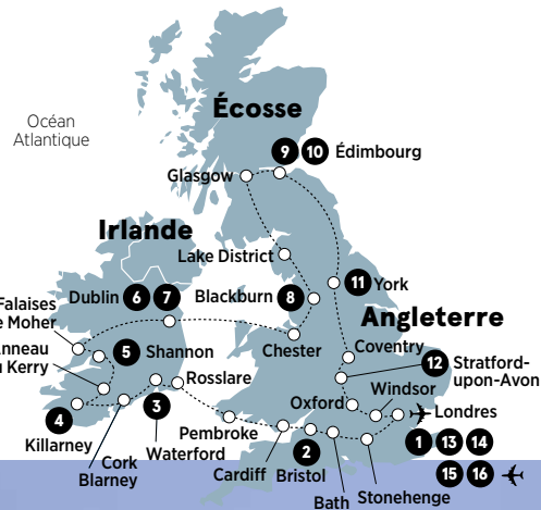
LUCIE SANCHAGRIN 13 SEPT. 2019