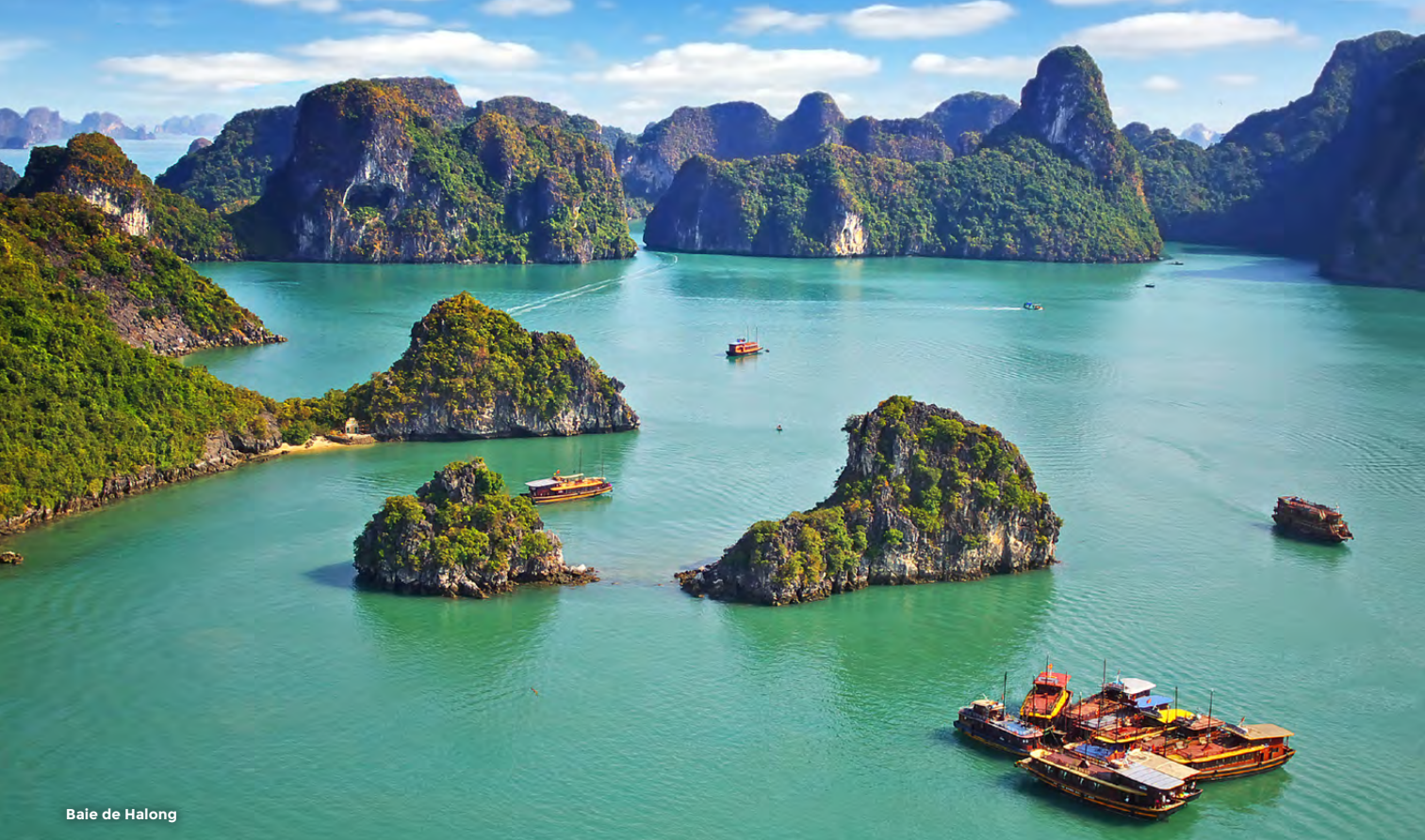
Baie de Halong