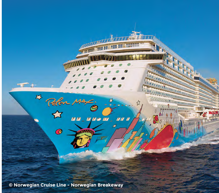
Norwegian Breakaway