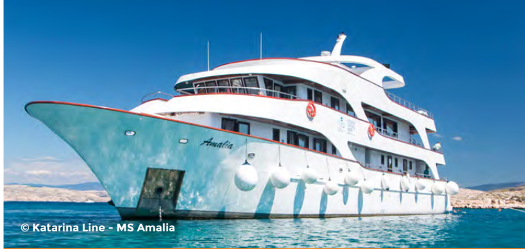
© Katarina Line - MS Amalia

Cette région vous fera voir certains des plus beaux villages et paysages de la Savoie dont Sixt-Fer-à-Cheval et son cirque naturel et le Grand Bornand.