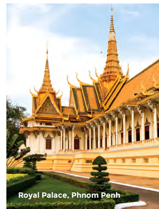
Royal Palace, Phnom Penh

Visite de la ville : le musée national, le palais royal et la pagode d'Argent, située dans son enceinte. Visite du Wat Phnom, symbole de la capitale. Dîner dans un restaurant local. Transfert à l'aéroport et vol pour Bangkok. Correspondance pour Taipei, puis Vancouver. L'arrivée est prévue le 16 novembre. PD/D