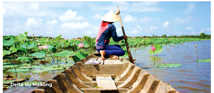
Delta du Mekong

Départ vers Hoi An. Arrêt au village des tailleurs de pierre de Non Nuoc. Dîner. Découverte à pied de Hoi An, le sanctuaire de Fujian, la pagode Phuc Thanh, les ruelles et le pont japonais. Visite d'un élevage de vers à soie. Souper. PD/D/S