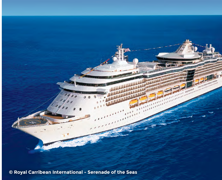
Serenade of the Seas

J13 Fort Lauderdale • Montréal Transfert vers l'aéroport pour votre vol de retour. (PD à bord du navire)