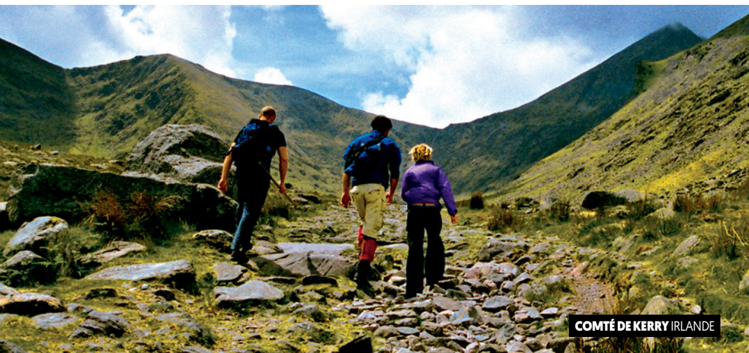
COMTÉ DE KERRY IRLANDE