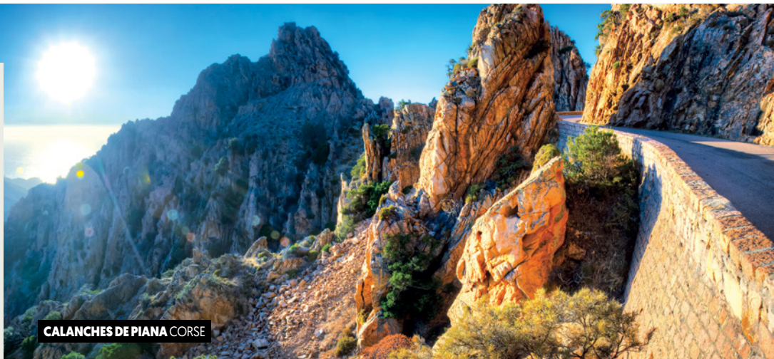
CALANCHES DE PIANA CORSE

1 Montréal • Marseille Vol vers Marseille.