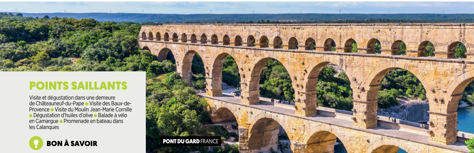
PONT DU GARD FRANCE