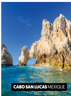
CABO SAN LUCAS MEXIQUE

17 Fort Lauderdale • Montréal Débarquement du navire, transfert vers l'aéroport pour votre vol de retour. (PDJ à bord du navire).