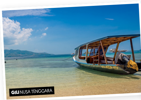
GILI NUSA TENGGARA

18 Kuta • Denpasar • Doha • Montréal Transfert à l'aéroport de Denpasar pour votre vol de retour. (PDJ)