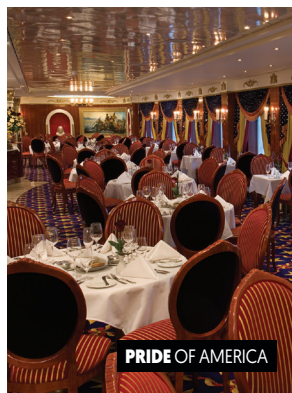
PRIDE OF AMERICA