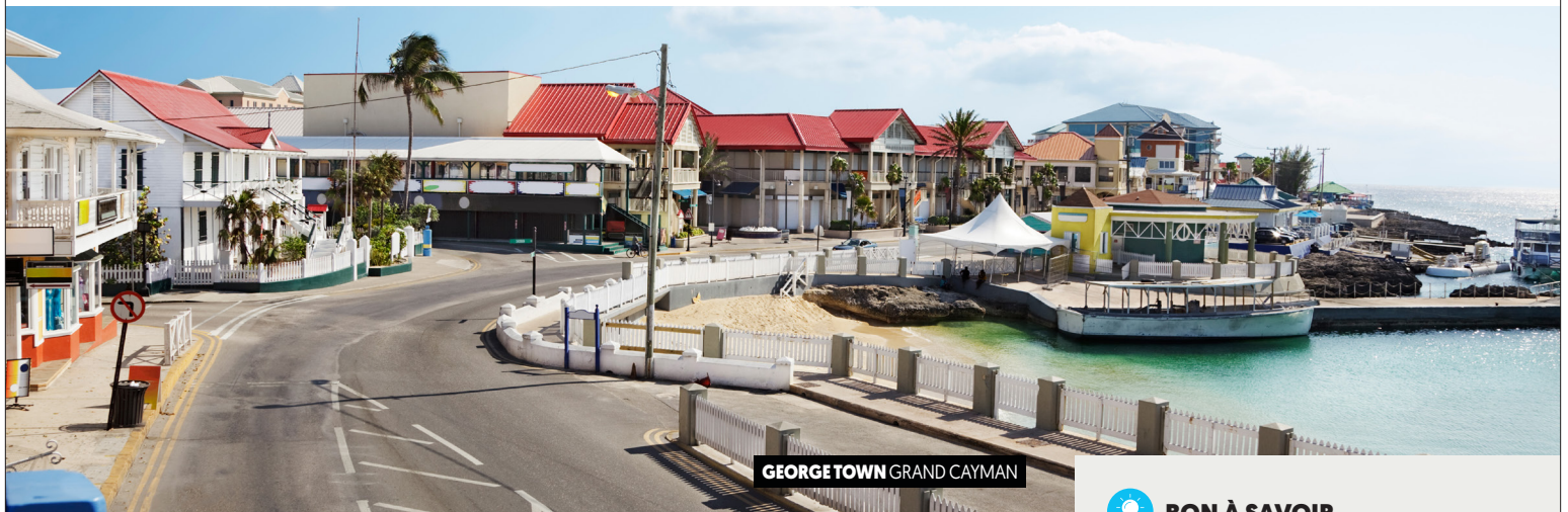
GEORGE TOWN GRAND CAYMAN