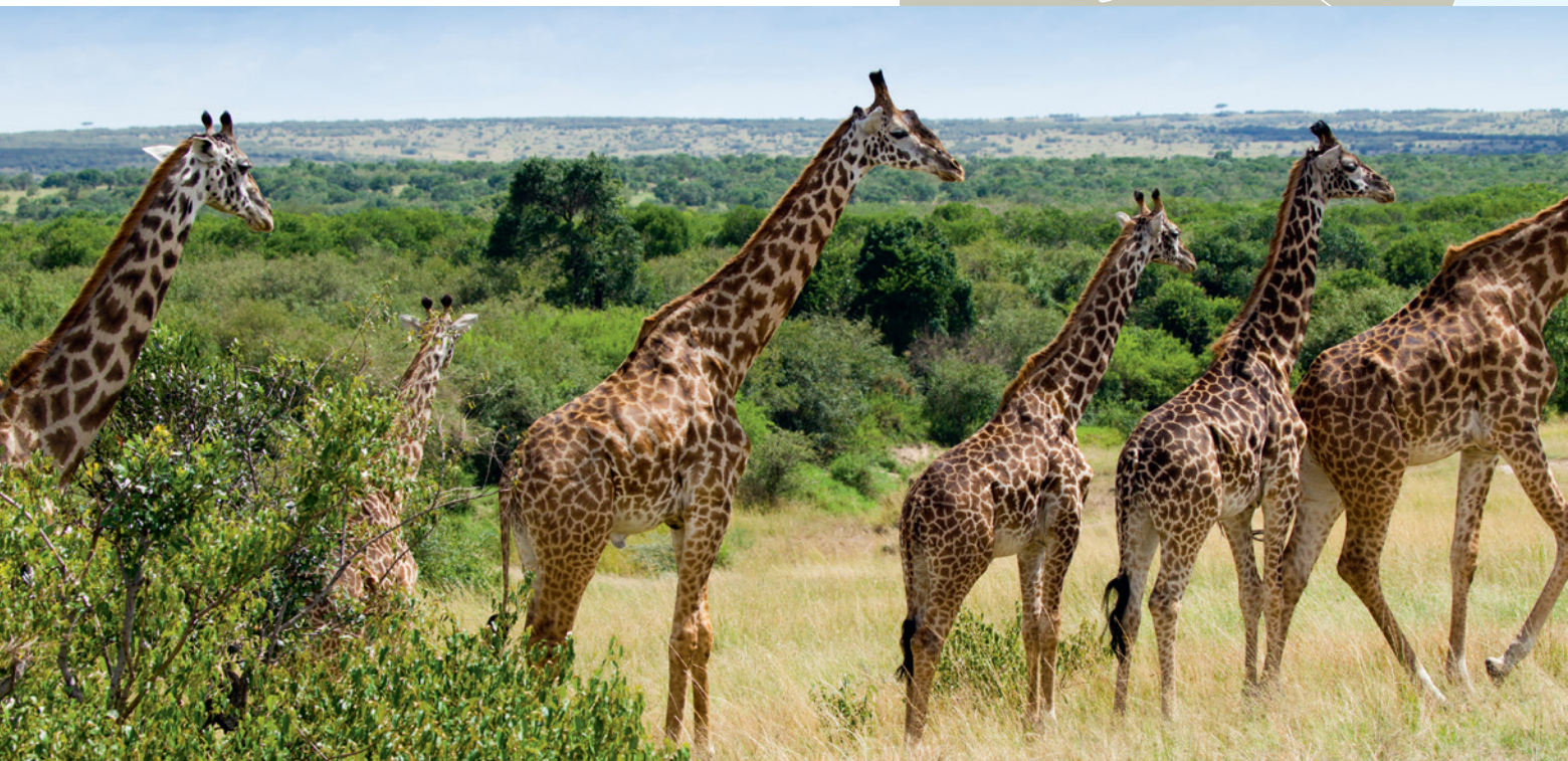
Réserve privée du Masai Mara