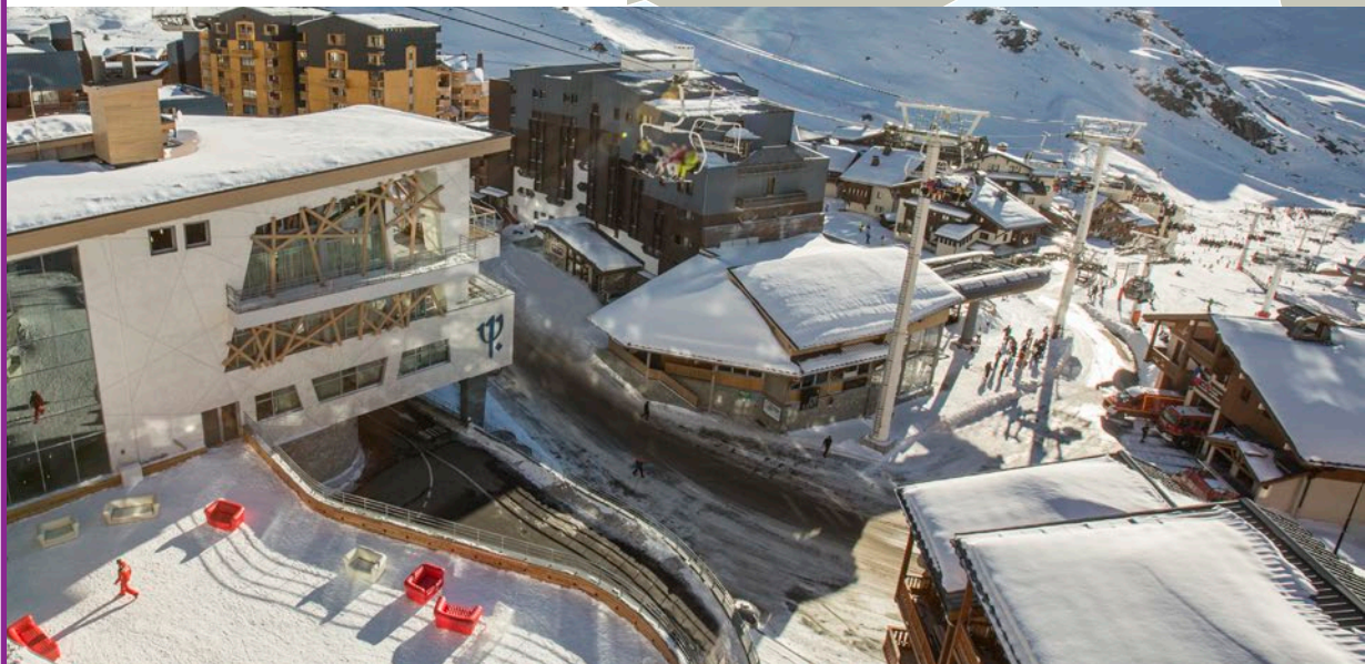
Village Val Thorens Sensations