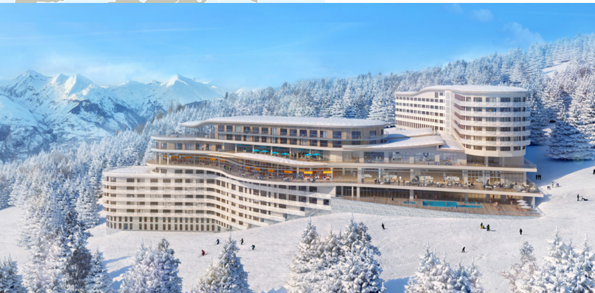
Club Med Les Arcs Panorama, France - Rendu d'artiste