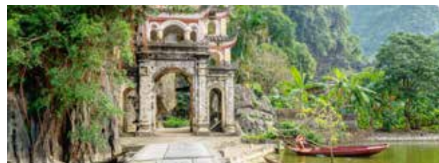
Temples de Bich Dong

Les prix sont par personne, basés sur une occupation double (taxes et frais inclus) pour un départ de Montréal avec vol aller-retour en Classe Économie sur les ailes de Qatar Airways (sous réserve de modification). • Supplément en occ. simple : 770$.