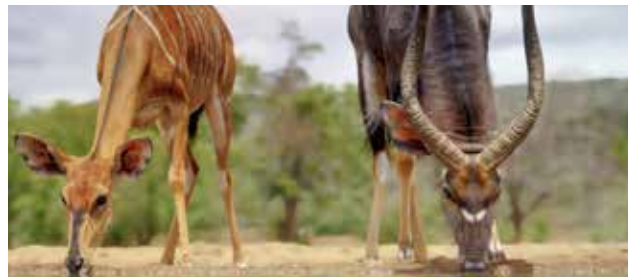
Réserve de Zulu Nyala

Les prix sont par personne, basés sur une occupation double (taxes et frais inclus) pour un départ de Montréal avec vol aller-retour en Classe Économie sur les ailes de KLM (sous réserve de modification). • Supplément en occupation simple : 1380$.