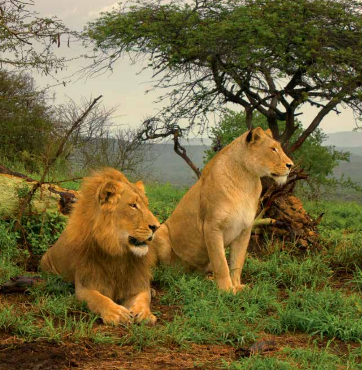
Parc national Kruger

et installation au lodge. Dans l'après-midi, safari 4 x 4 dans la réserve. Souper Boma ou buffet. (PDJ, D, S)