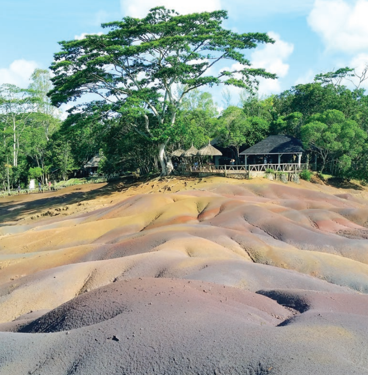
Chamarel, île Maurice