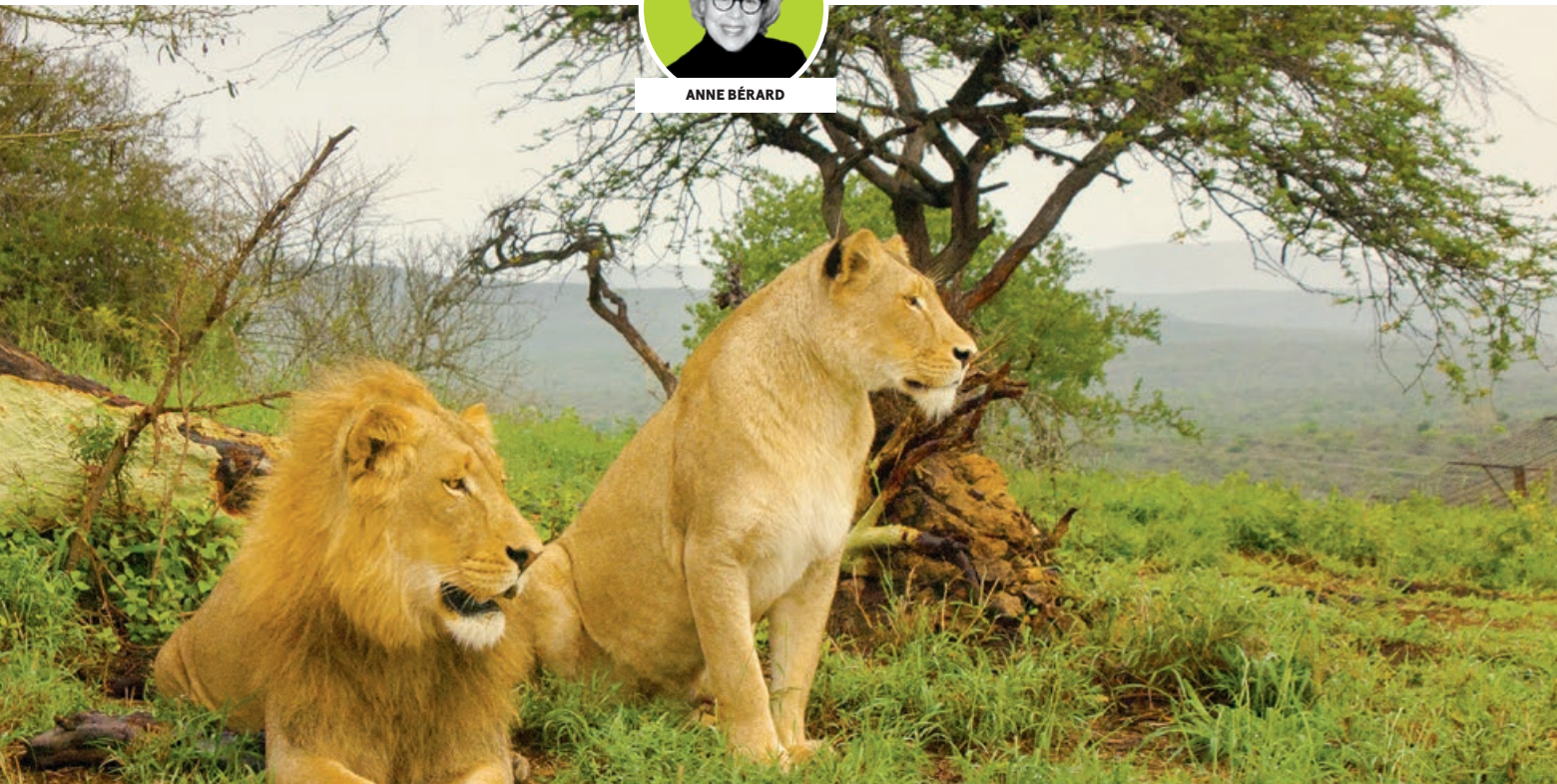
Parc national Kruger