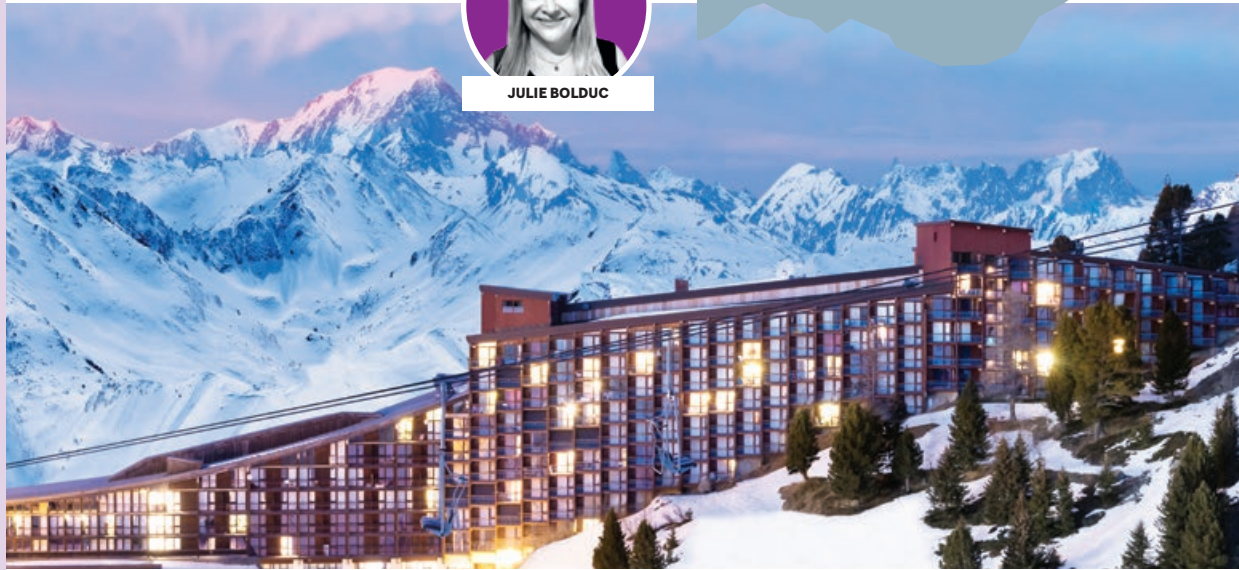
Club Med Les Arcs Extrême