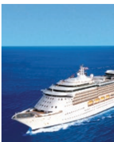
Serenade of the Seas