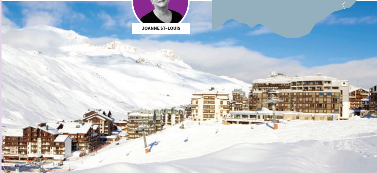
Village Tignes Val Claret