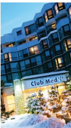
Club Med Tignes Val Claret

Carte de membre en sus (35$) • Les prix sont par personne, basés sur une occupation double (taxes et frais inclus) pour un départ de Montréal avec vol aller-retour en Classe Économie sur les ailes d'Air Canada (sous réserve de modification). • Supplément en occupation simple sur demande.