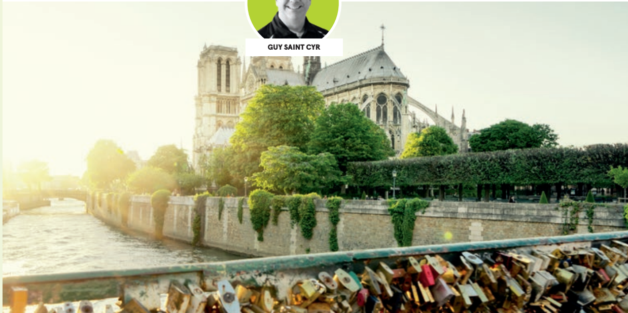
Le pont des Arts