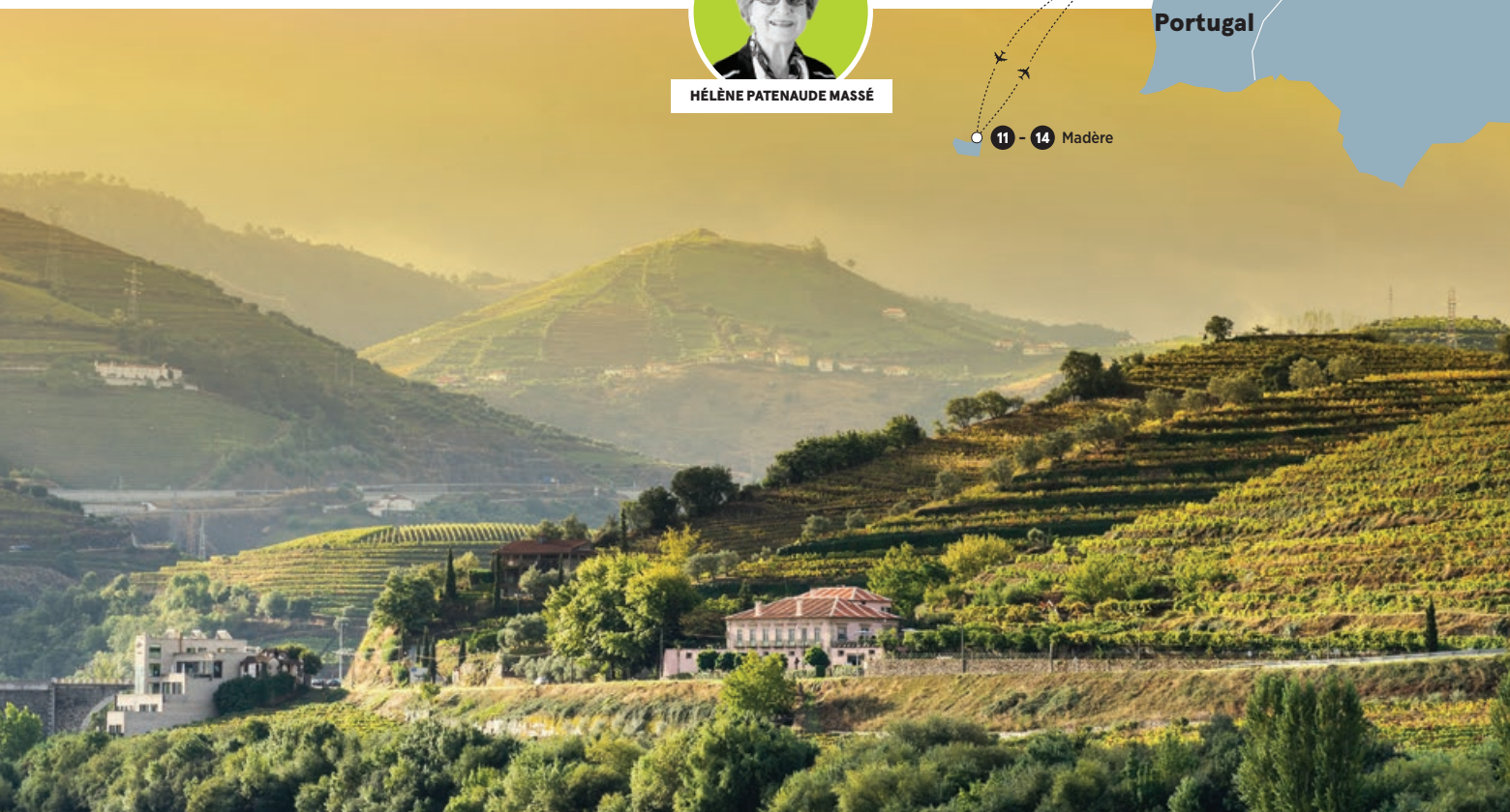
Vallée du Douro