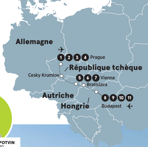
MARIE-JOSÉE POTVIN 1 ER JUIN 2020