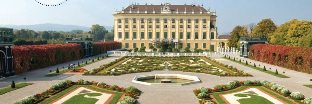
Château de Schönbrunn