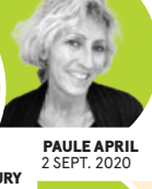
PAULE APRIL 2 SEPT. 2020