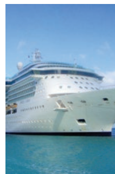
Jewel of the Seas