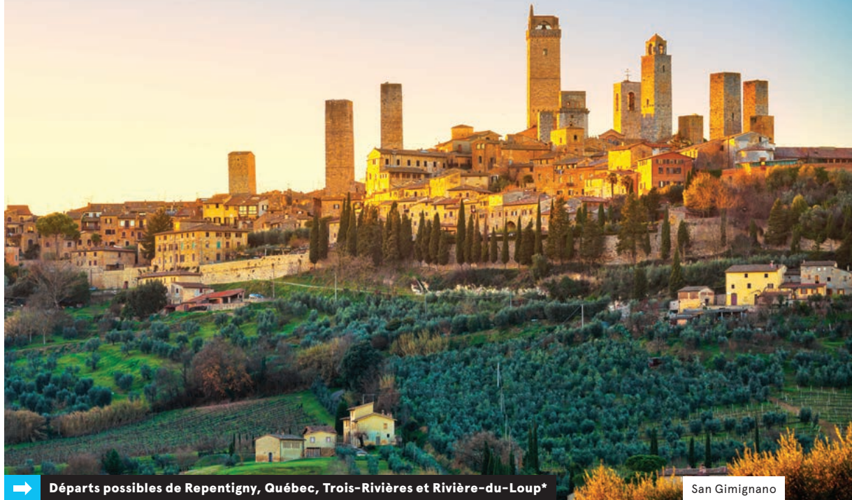
Fabienne Pilotte 6 oct. 2020

→ Départs possibles de Repentigny, Québec, Trois-Rivières et Rivière-du-Loup*