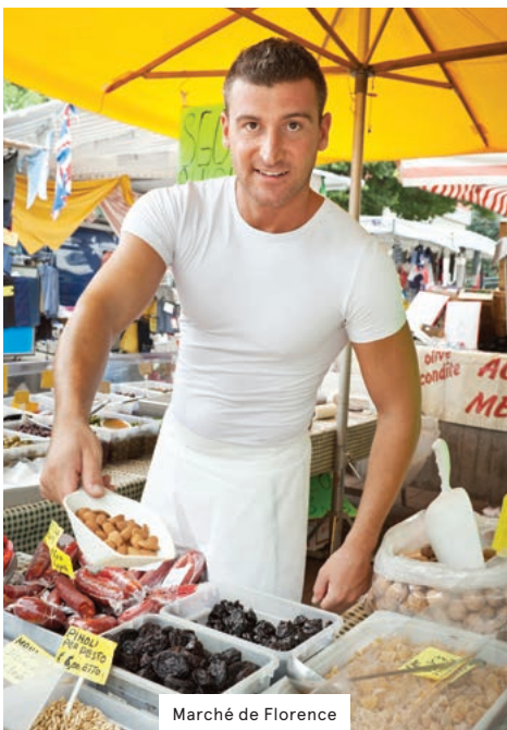
Marché de Florence