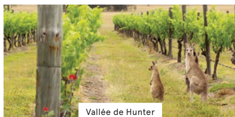
Vallée de Hunter