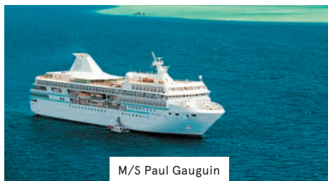
M/S Paul Gauguin