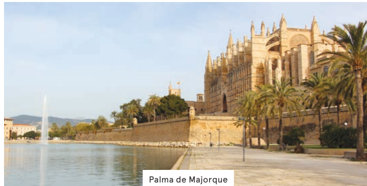
Palma de Majorque

* L'itinéraire peut être modifié sans préavis. Réservation et dépôt: Un dépôt non remboursable de 1 200 $ par personne en occupation double (950$ pour Croisières Encore et 250$ pour Transat) ou 1 600 $ par personne en occupation simple (1 290 $ pour Croisières Encore et 310 $ pour Transat) est requis au moment de la réservation.