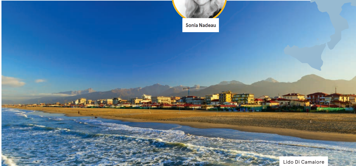
Lido Di Camaiore