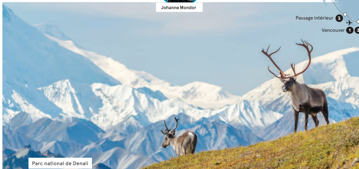
Parc national de Denali