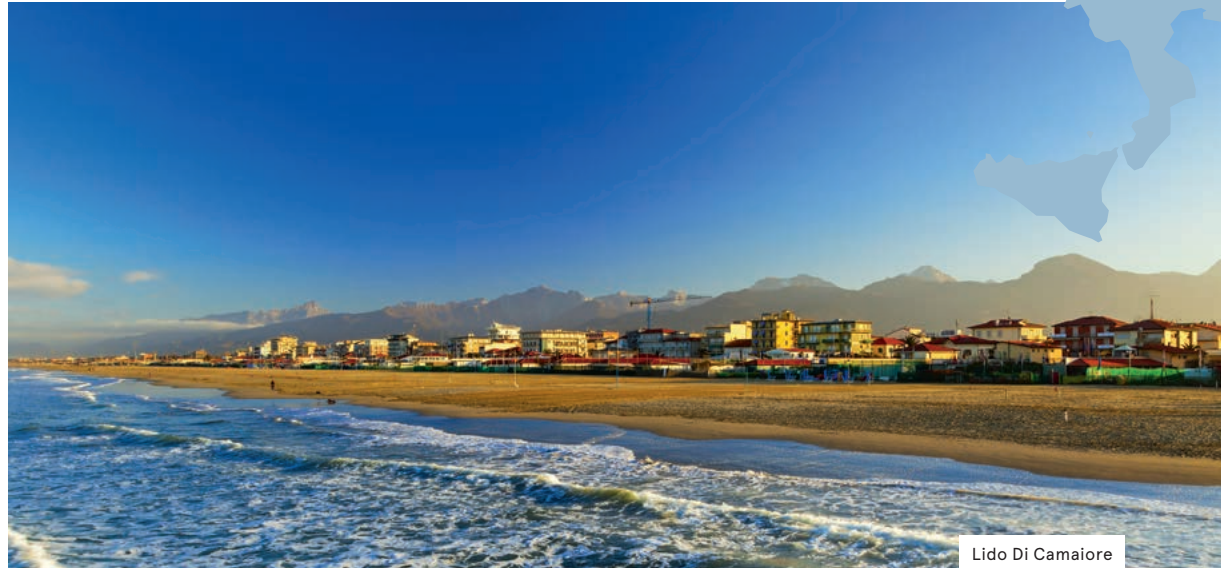
Lido Di Camaiore