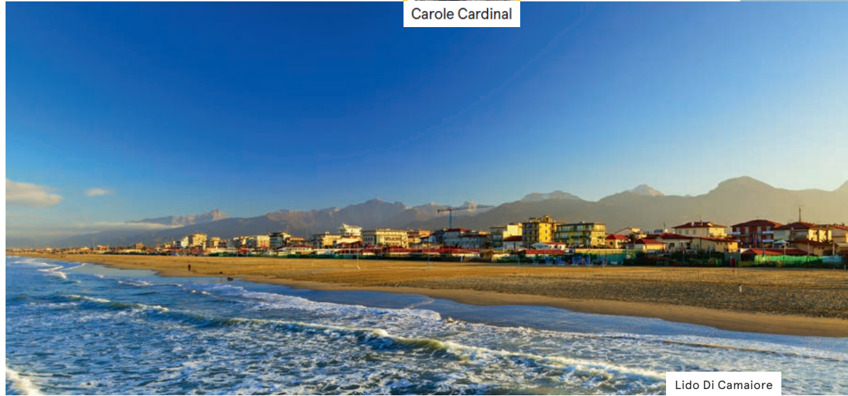
Lido Di Camaiore