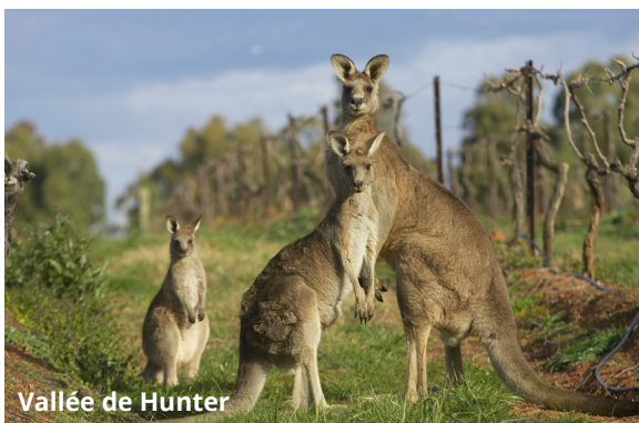
Vallée de Hunter