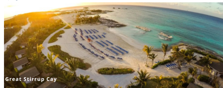
Great Stirrup Cay

L'hôtel peut être remplacé par un autre de catégorie équivalente selon la disponibilité.