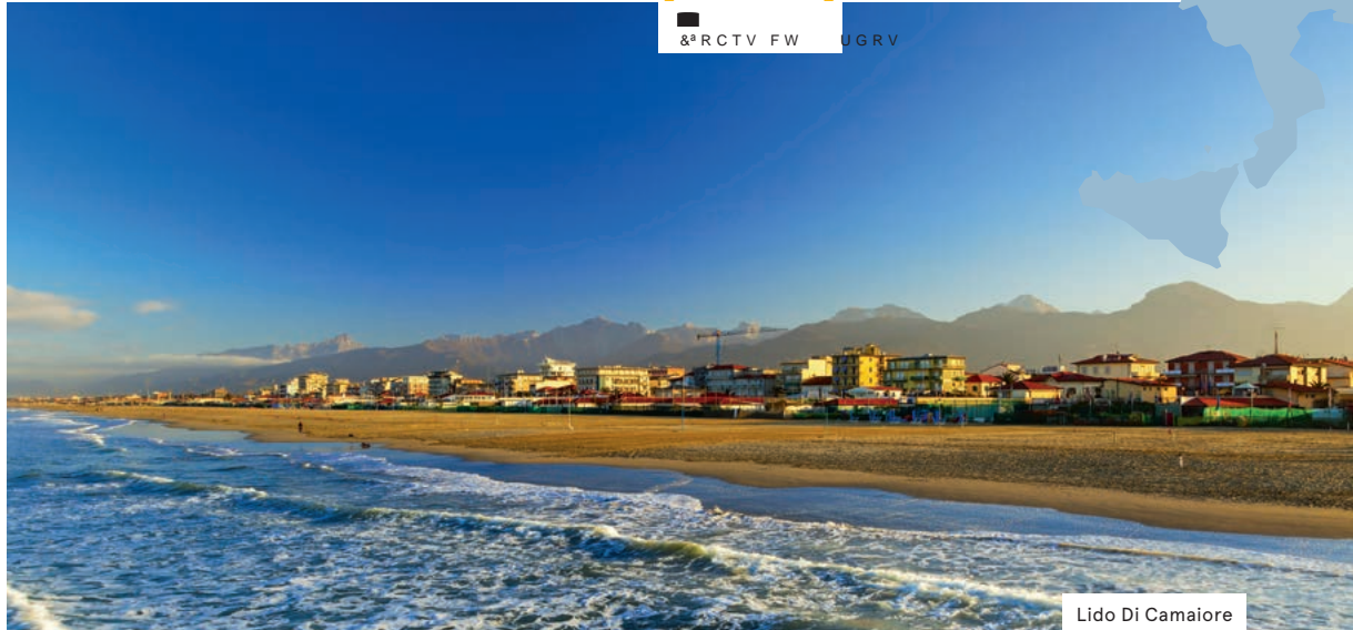
Lido Di Camaiore

Un magnifique séjour dans la région balnéaire de Viareggio, sur la Riviera Italienne. Vous vivrez la dolce vita!