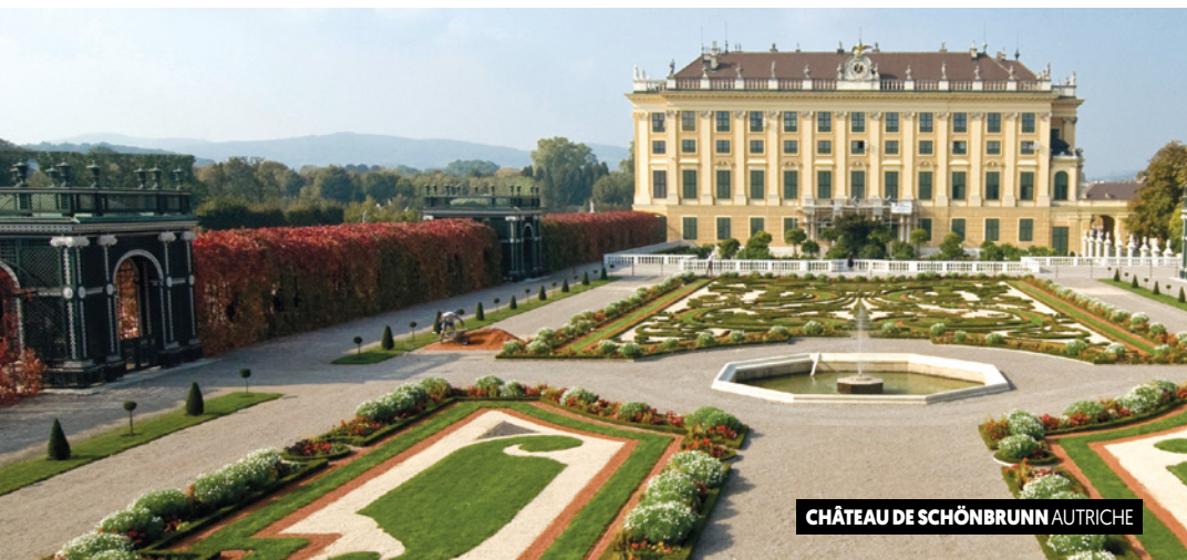
CHÂTEAU DE SCHÖNBRUNN AUTRICHE